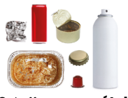
Emballages en métal et les petits aluminiums